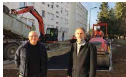
La voie et le parking devant les immeubles de l'allée Gérard Philipe.