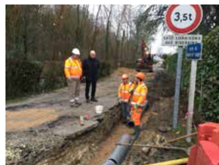
Réfection du réseau d'eau pluviale rue du chemin vert