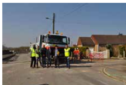
Réfection des rues des Lilas, des Bégonias et des Clématites suite aux travaux de Bourges Plus