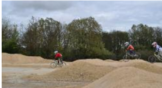
La piste du terrain de bicross

terrain de bicross. Dans ce cadre, l'actuelle grille de départ manuelle sera remplacée par une grille à commande automatique. Dans le même temps, des travaux d'adaptation et de remise en état de la butte de départ seront réalisés.