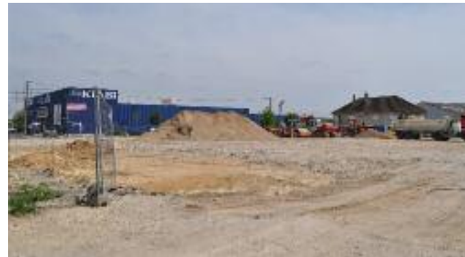
Emplacement de l'ancienne imprimerie CCIF

Le budget 2013 est notamment marqué en investissement par la réalisation de deux chantiers importants: celui de la restauration collective qui représente un investissement majeur pour Saint Germain du Puy, et celui de la remise aux normes et de l'amélioration de la piscine municipale, chantier qui va impliquer la fermeture de cet équipement pour une période de quatre mois de juin à septembre.