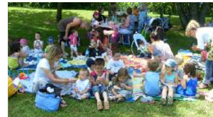
Le pique-nique du RAM

Au service des familles qui recherchent une garde pour leur enfant et au service des assistantes maternelles en ce qui concerne leur métier, leurs droits, Le RAM est aussi un lieu d'accueil où les enfants peuvent venir avec leur « nounou » participer à des activités utiles à leur développement et à