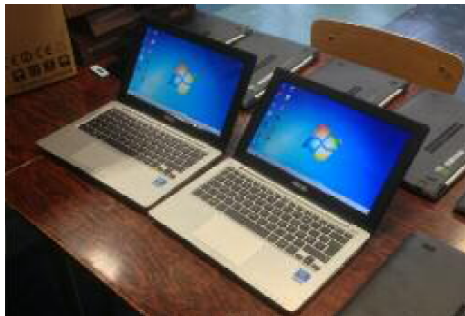
Les ordinateurs portables des classes mobiles

En remplacement d'une salle informatique désuète et aujourd'hui peu pratique, le conseil municipal, en accord avec les enseignants de l'école primaire a décidé de procurer à ces derniers des moyens informatiques nouveaux et conséquents, disponibles et utilisables dans les classes.