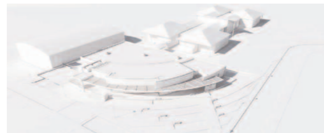
Maquette (Visuel Atelier CARRE D'ARCHE)

La Ville et le Conseil Général ont validé le fait que le retrait de la mutualité ne remettait pas en cause le projet de cuisine centrale et ses salles de restauration collective, projet sur lequel travaillent ces deux collectivités depuis leur décision conjointe de 2007 de poursuivre la mutualisation des besoins de la ville et du Conseil Général en terme de restauration collective.