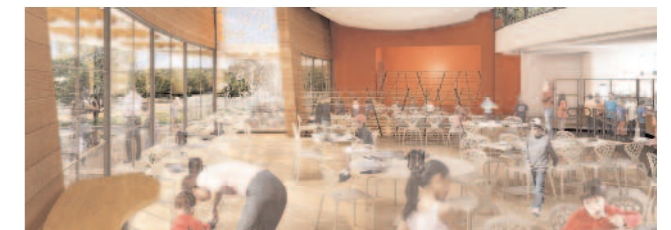
Vue des salles interieures

Ainsi, très lumineux grâce à de grandes baies vitrées, ce bâtiment offrira un cadre neuf et accueillant pour faire du repas un moment de détente et ainsi bien profiter de ce qui sera servi dans l'assiette.