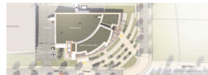
Vue d'ensemble (Visuel Atelier CARRE D'ARCHE)

Il est conçu pour donner à chacun, au moment du repas, suffisamment d'espace et de confort. Chaque public mangera dans