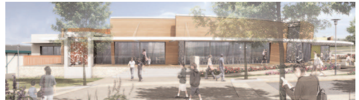
Vue facade (Visuel Atelier CARRE D'ARCHE)