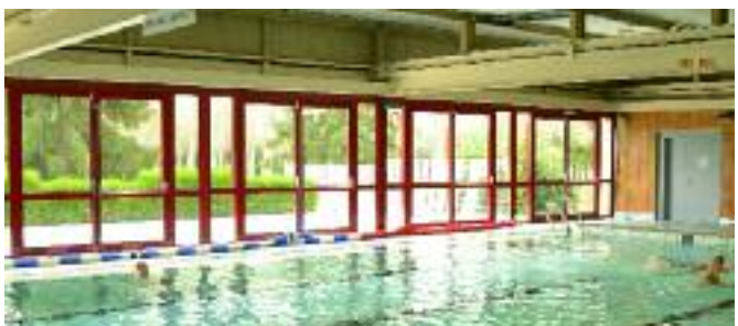
Remplacement des baies vitrées côté solarium