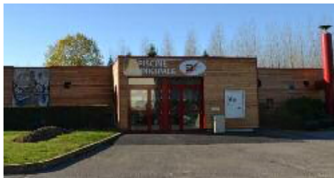
Travaux d'isolation extérieure